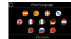
Selección de idiomas