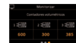
Monitorización contadores volumétricos