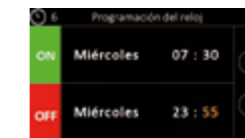
Programación encendido y apagado