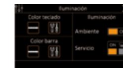
Control de iluminación y color