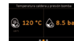
Monitorización temperatura caldera y presión bomba