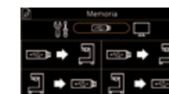
Transferir salvapantalla y parámetros