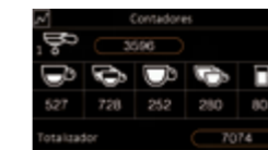
Contador de cafés